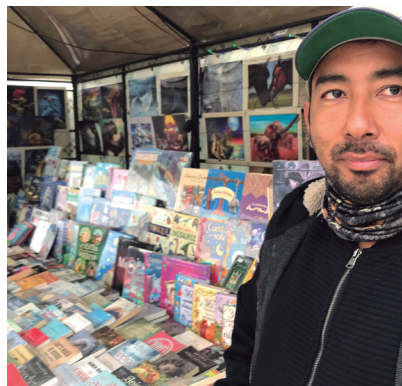
Caldera, Bahía Inglesa Librería Nueva Era