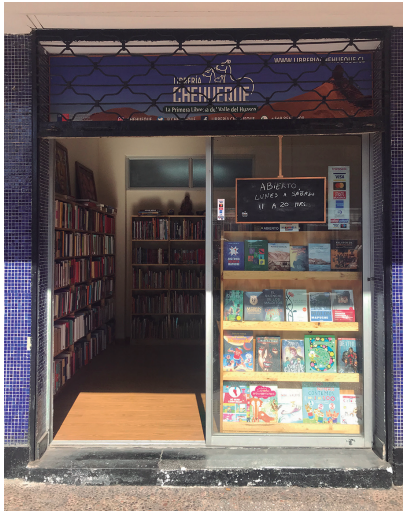
Huasco, Vallenar Librería Chehueque