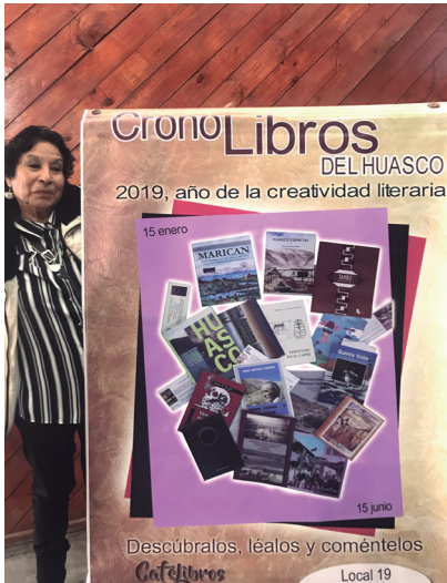
Huasco, Vallenar Café...libros