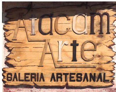
Huasco, Freirina Galería AtacamaArte