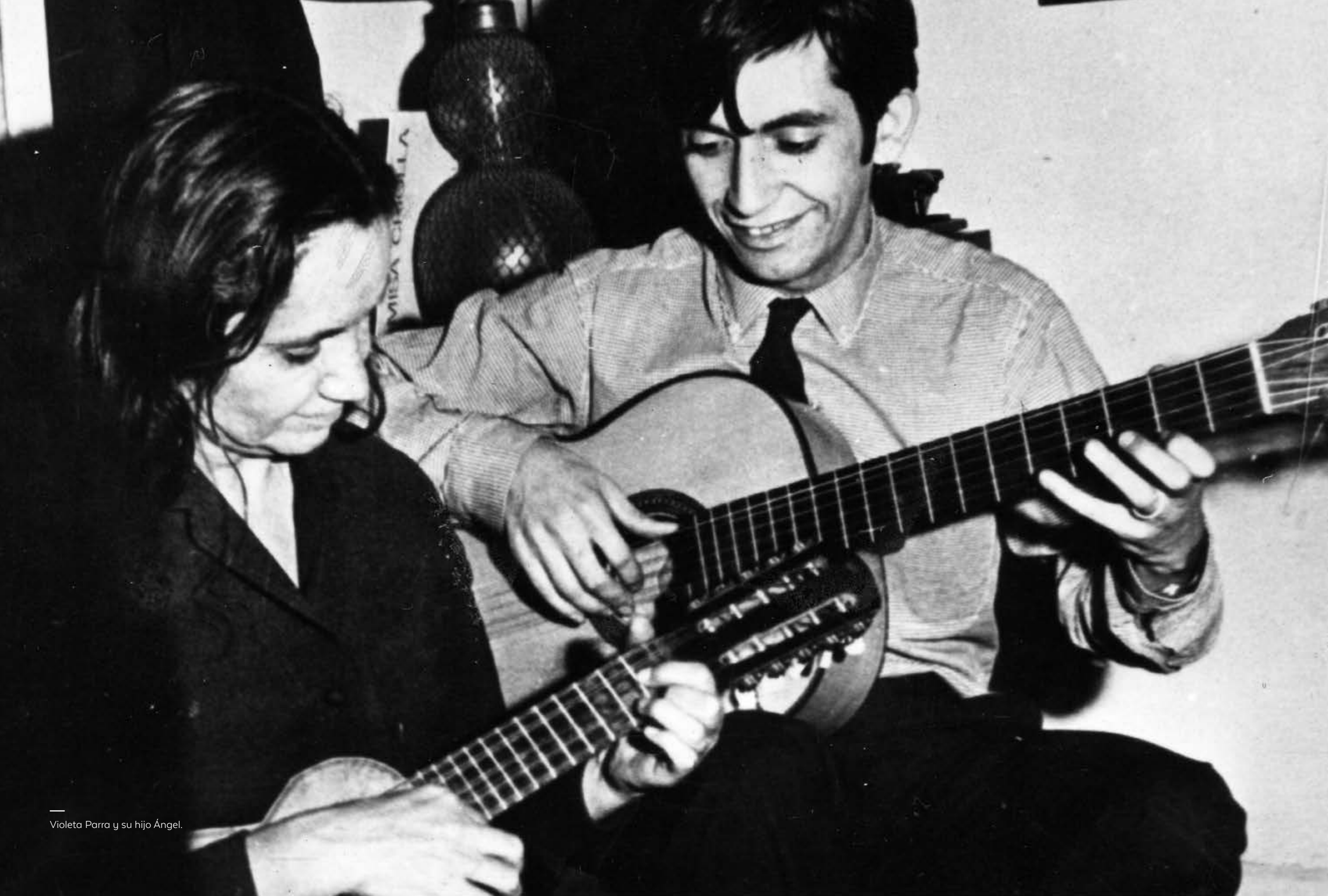
Violeta Parra y su hijo Ángel.