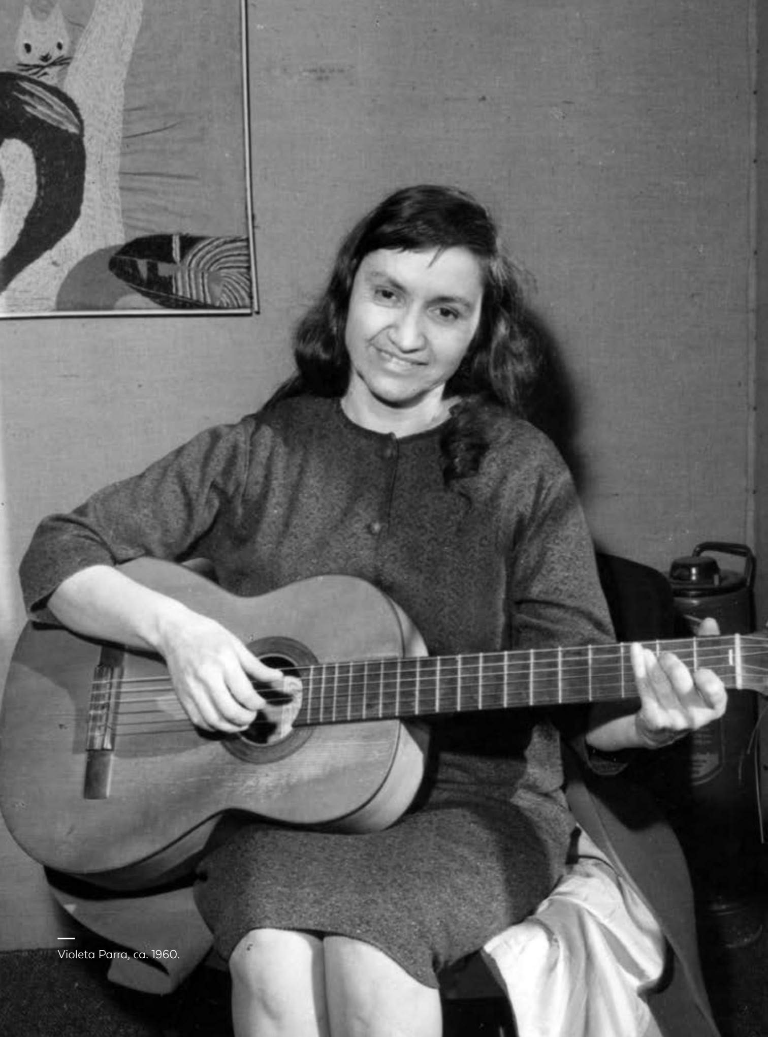
Violeta Parra, ca. 1960.

Cada año el Consejo Nacional de la Cultura y las Artes conmemora a un(a) autor(a) nacional que, por su trayectoria, ha sido relevante para el mundo del libro y la lectura. Este 2017 celebramos los 100 años del nacimiento de la que es una de las más grandes creadoras de nuestro país, Violeta Parra.